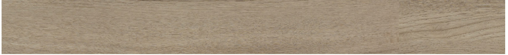
24896622 - Barbaresco