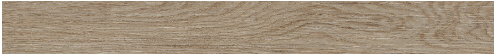
24896710 - Isolabella