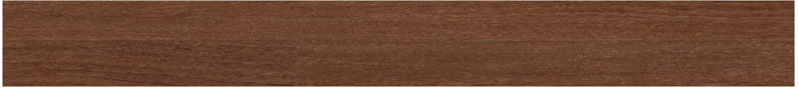
24896656 - Alba